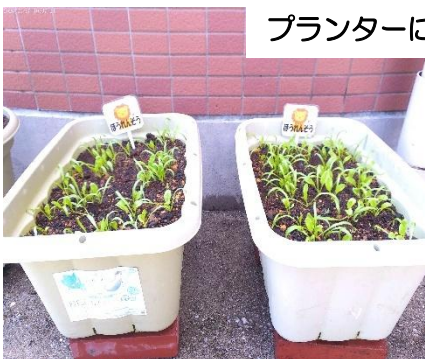
プランターに苗植え・種まき