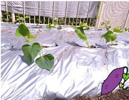
さつまいも苗植え

今年も食育の一環として、野菜やお米を育てています。5月は、夏野菜の苗植えや種まき、田植えを幼児クラスが行いました。園庭のプランターでは夏野菜がすくすくと育っています。さつまいも畑と田んぼにはまだ小さな苗が整列。各クラスのお当番さんが交代で毎日水やりをしてくれています。収穫が待ち遠しいですね。